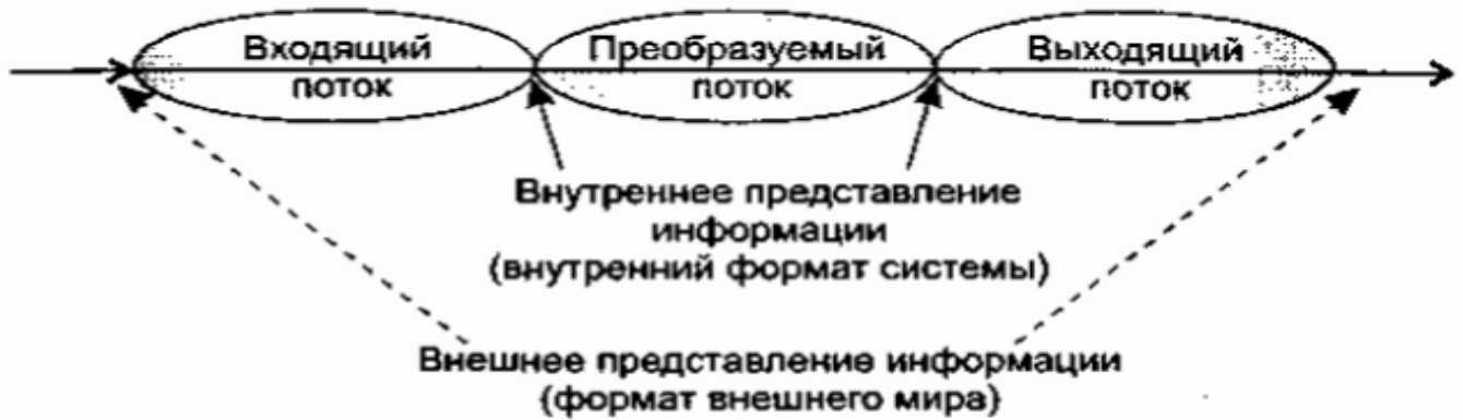
Рис. 5.1. Элементы потока преобразований