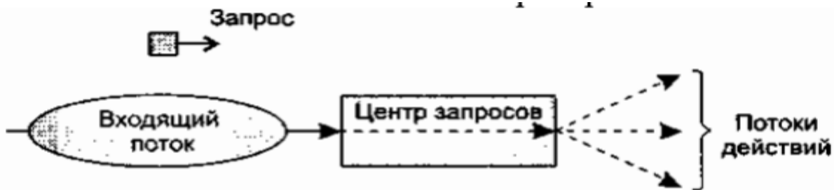
Рис. 5.2. Структура потока запроса

1. в потоке преобразований выделяют 3 элемента: