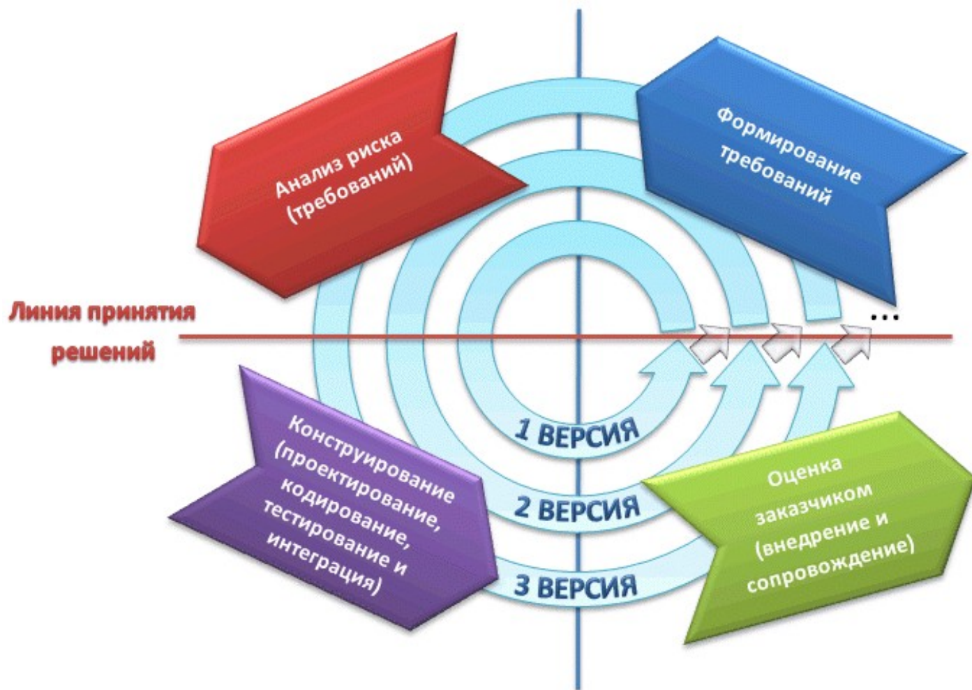
Рис. 3.3. Спиральная стратегия

Суть метода, что весь процесс создания конечного продукта представлен в виде условной плоскости, разбитой на 4 сектора, каждый из которых представляет отдельные этапы его разработки: определение целей, оценка рисков, разработка и тестирование, планирование новой итерации.