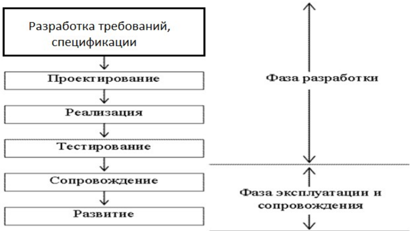
Рис.3.1. Каскадная стратегия

Данная модель применяется при разработке информационных систем, для которых в самом начале разработки можно достаточно точно и полно сформулировать все требования.